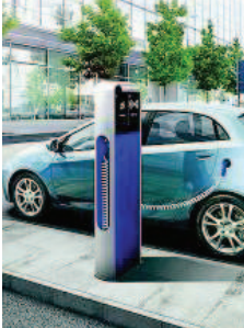
Una colonnina per auto elettriche