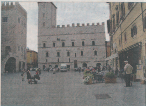
Piazza del Popolo La partenza è prevista alle 15,30 di domenica