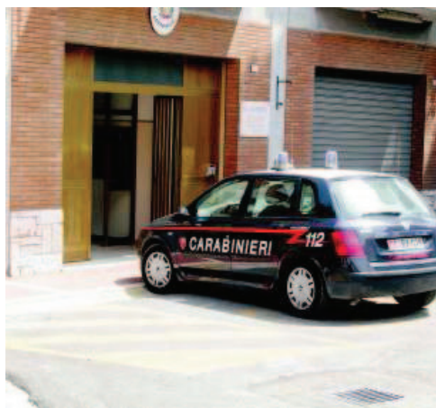
L'attuale caserma dei carabinieri di Todi

presso Palazzo Gregori, immobile di proprietà della curia vescovile adiacente al Palazzo del Vignola. La scelta di quella sede, che come si ricorda prese le mosse dall'indicazione dell'amministrazione comunale che la "consiglio" come ideale perché finalizzata a far rivivere il centro storico, mostra invece sempre maggiori perplessità mettendo ancora più a nudo la notevole incompatibilità logistica con il tipo di servizio, basato anche a interventi di emergenza che devono svolgere i militari dell'Arma dei carabinieri. Ci si chiede dell'opportunità o meno di prevedere un presidio militare nelle vicinanze di una scuola elementare, di un cinema, di un palazzo espositivo come quello del Vignola. Ulteriori perplessità riguardano anche l'urgenza di voler pro-