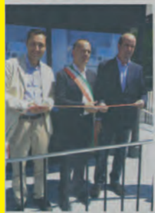
Il taglio del nastro

GUBBIO - Il progetto "Fontanelle", realizzato in collaborazione con Ati 1 e 2, Regione e Umbra Acque approda anche a Gubbio. È stata inaugurata ieri mattina la nuova fontanella nel parcheggio del centro commerciale "Le Mura". L'impianto potrà erogare acqua naturale e gassata, proveniente dall'acquedotto pubblico, trattata attraverso il carbonio attivo e raggi ultravioletti. Il costo sarà di 5 centesimi ogni litro e mezzo. L'obiettivo è quello di risparmiare nell'utilizzo delle bottiglie di vetro e plastica, (meno 8 milioni con le 12 fontanelle ad oggi