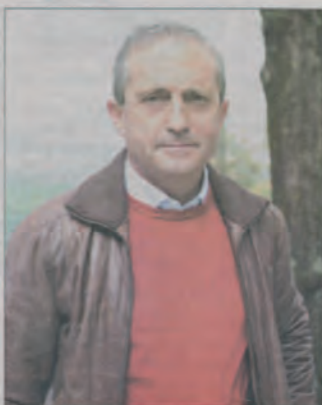
Fantasylandia per due sere al centro di un'iniziativa di un gruppo ceraiolo

Gubbio CORRIERE DELL'UMBRIA Domenica 13 Maggio 2012 27